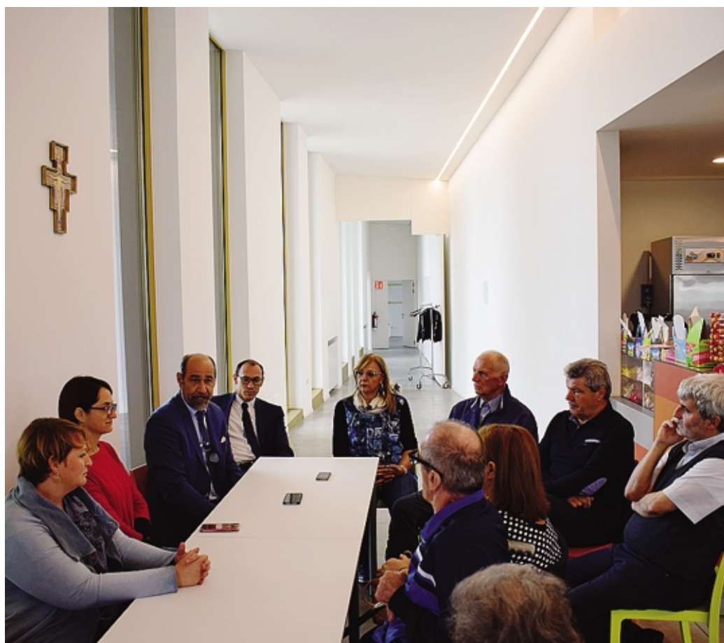
L'inaugurazione del progetto «Alzheimer Caffè» ieri a Cavernago

«Quello di Cavernago - ha aggiunto Cortesi - è il terzo Alzheimer Caffè che viene aperto. Si tratta di una realtà che deve il più possibile diffondersi per dare una risposta quanto più completa a un'esigenza che, nei nostri territori, sta diventando sempre più importante. Vorrei sottolineare la bellezza e l'importanza del fatto che, questi «caffè» si inseriscono in contesti di vita ordinaria: luoghi, quindi, che non sono finalizzati unicamente a ricevere questo tipo di servizi, ma che si innestano all'interno di una realtà già consolidata sulla quale può essere svi-